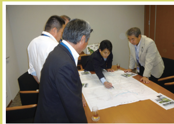
9月4日 滝波参議院議員 市内河川改修要望