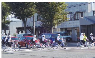
9月22日 秋の交通安全県民運動街頭啓発