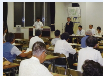
8/20 坂井市議会報告会