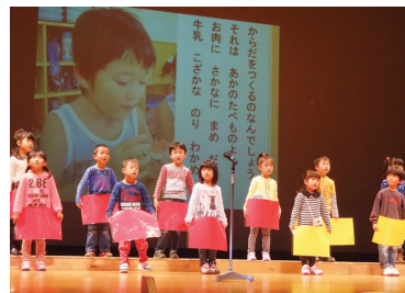
11月8日 坂井市健康都市宣言式典参列