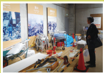
9月4日 東京臨海広域防災体験学習館視察