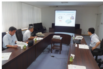
8月19日 大阪府茨城市福祉ネットワーク研修