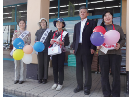
10月11日 赤い羽根街頭募金協力