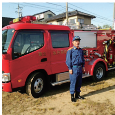
8月3日 嶺北消防組合消防総合訓練参列