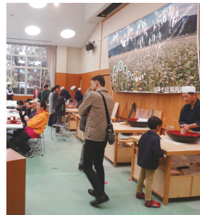
11月15日 丸岡産新そばまつり出席