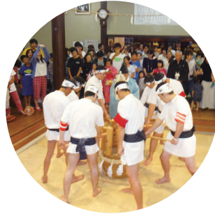
9月14日 表児の米神事参列