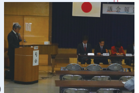
11/27 坂井市議会報告会