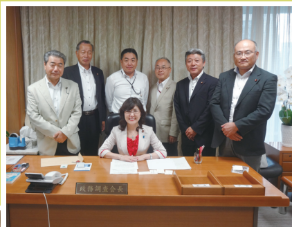
9月4日 稲田政務調査会長表敬訪問