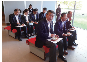
10月26日 坂井市民文化祭総合開会式参列